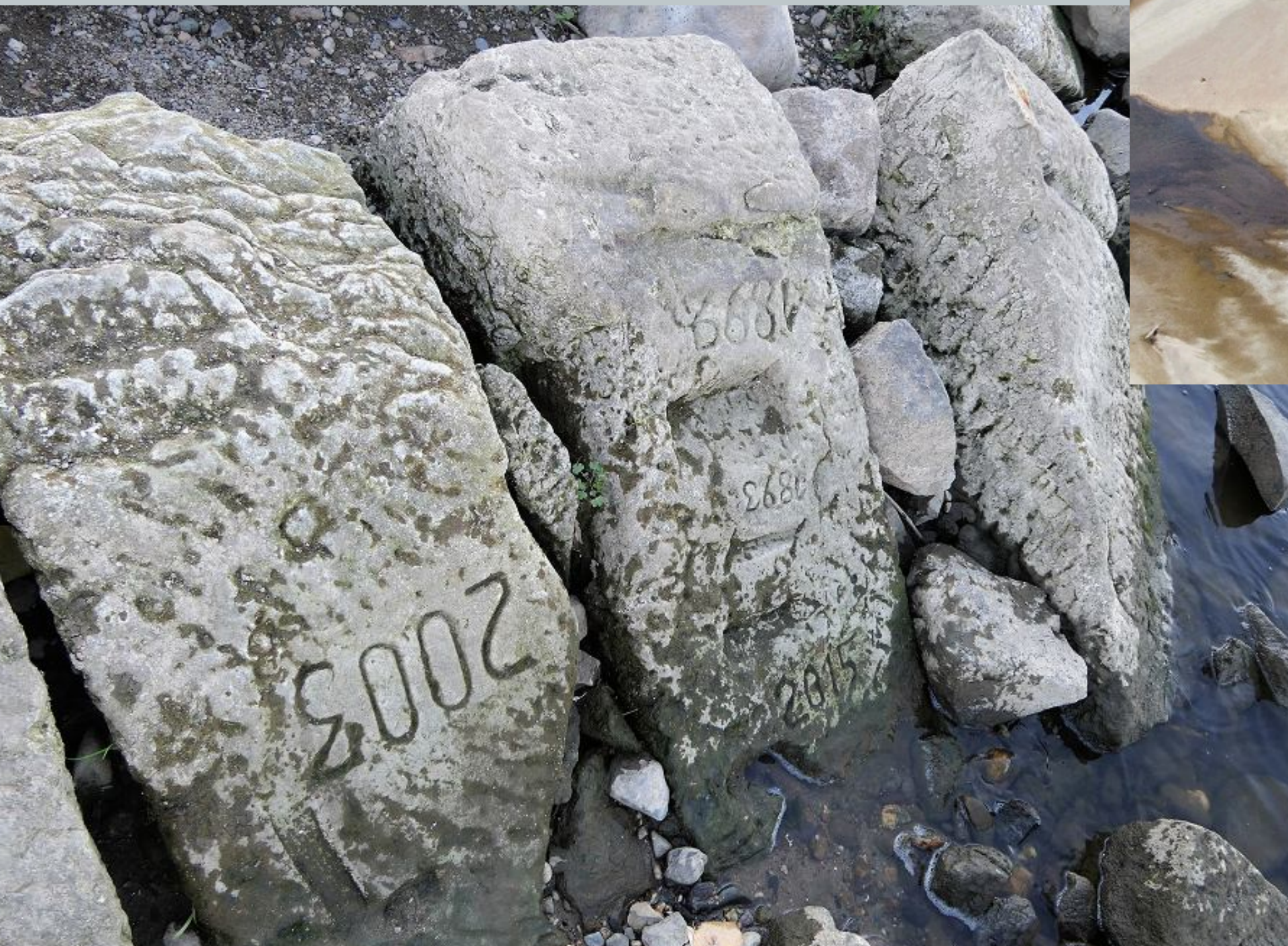
Kamienie głodu na dnie rzeki Ren