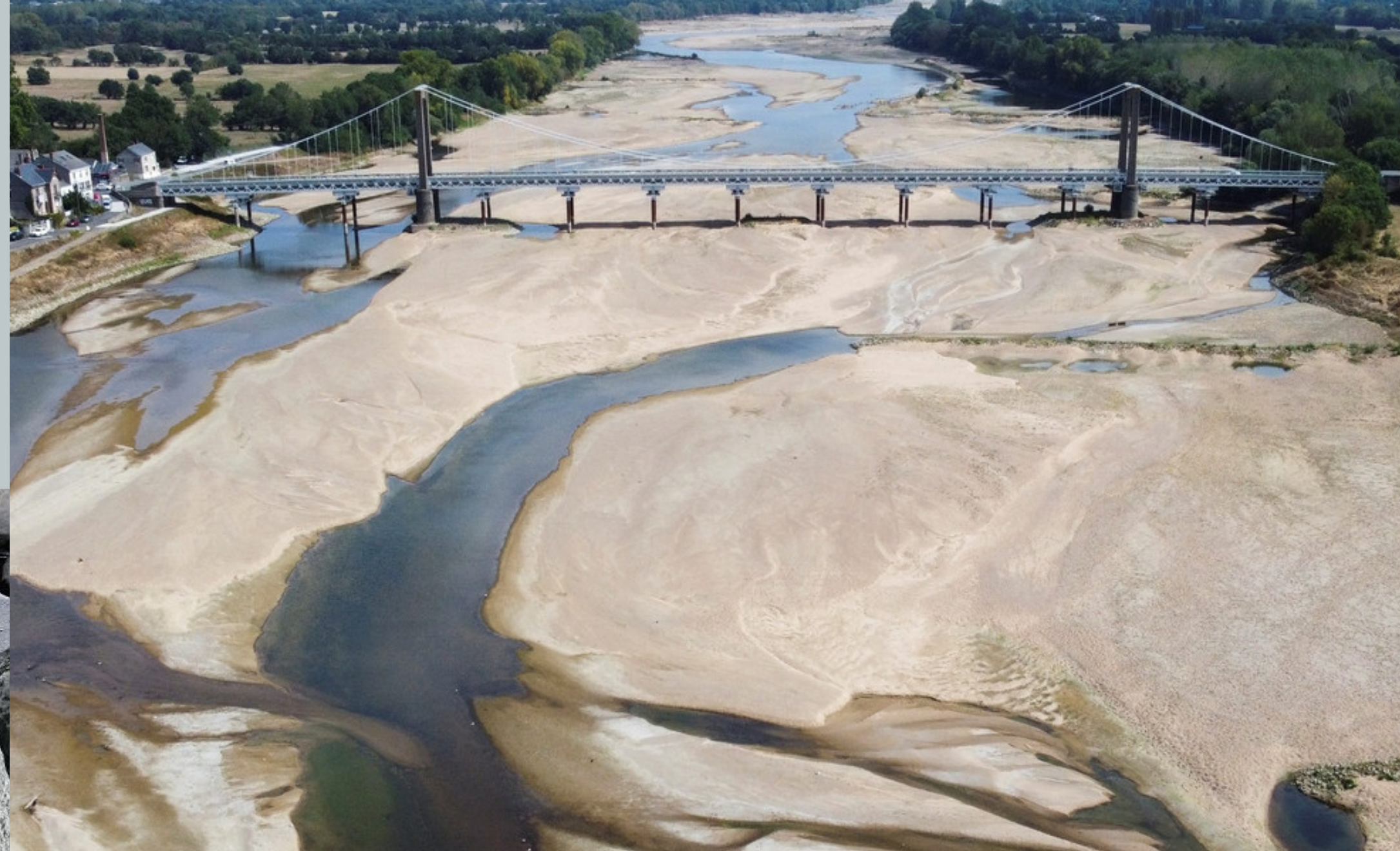
Największa rzeka Francji - Loara